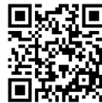
参加申し込み用QRコード